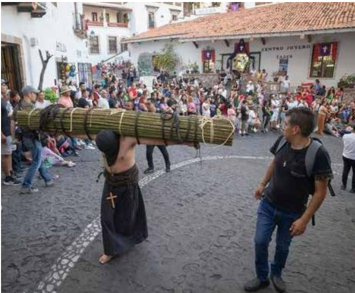
Procesión de Semana Santa en Taxco